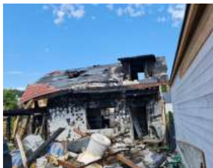
UL. REJA 2, KAMIENNA GÓRA, budynek gospodarczy po pożarze, (403/9/21)