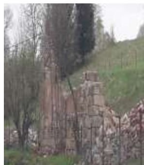
UNIEMYŚL Budynek gospodarczy (403/17/20)