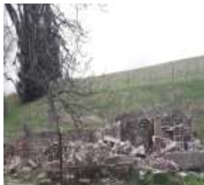
UNIEMYŚL Budynek gospodarczy (403/16/20)