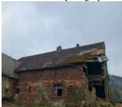
PAPROTKI, Budynek gospodarczy, (403/19/21)