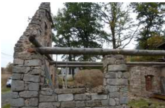
UNIEMYŚL Budynek gospodarczy (403/21/15)