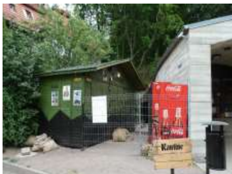
UL. PARKOWA, KAMIENNA GÓRA obiekt budowlany obok „ARADO” (401/10/15)