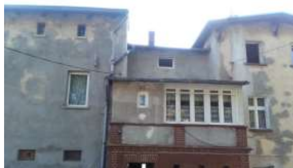
UL. KOŚCIUSZKI 54, KAMIENNA GÓRA Nadbudowa balkonu (401/5/15)