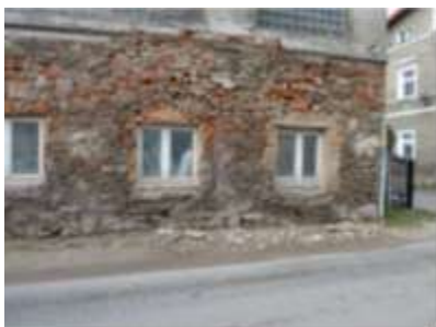
PISARZOWICE 50 budynek mieszkanie – gospodarczy (403/4/12)